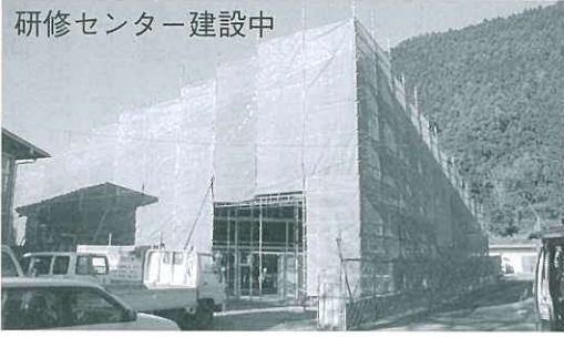
研修センター建設中

質問 私は、農林業センターの運営について伺います。農林業センターの位置づけは、川根茶の中枢施設として、また茶業者のよりどころとしてなくてはならない施設でございませぬ。全国の茶産地にありましても、このような施設は珍しく、内外より多くの視察もあり、町行政の茶業にける熱