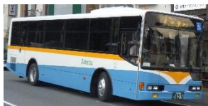
千頭・家山線バス

11,000円分 の町営バス回数券の交付（50円券×220枚） （千頭・家山線バス、寸又峡線バス、デマンドタクシー「おでかけ号」で利用できます。）