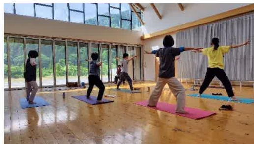
※開催会場は写真とは異なります

（64歳以下：1,850円、65歳以上：1,200円） 申込時に生年月日(年齢)をお知らせ下さい。