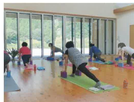
※開催会場は写真とは異なります

（64歳以下：1,850円、65歳以上：1,200円） 申込時に生年月日(年齢)をお知らせ下さい。