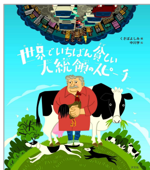
山村開発センター 図書室所蔵

貧乏とは、少ししか持っていないことではなく、無限に欲があり、いくらあっても満足しないこと