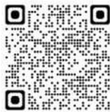
マイナポータル「引越し手続」

なお、マイナポータルによる転出届の提出をした後は、転入先市区町村の窓口での転入の手続きが必要となります。