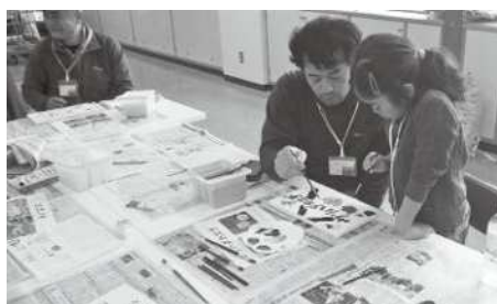
樹名板を作成している様子

参加者からは「手作りの樹名板を付けることで山が明るくなった」「自分で作った樹名板がどうなっているかまた見に来たい」などの声が寄せられました。