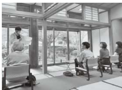
茶茗館で全国茶品評会上位入賞茶を楽しむ様子