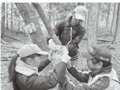
樹名板を設置している様子