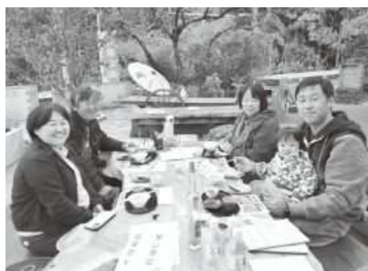
サテライト会場の様子

これまでフォーレなかかわね茶茗館へお茶の匠たちが集まり、川根茶をふるまってきた川根時間ですが、今年は、通算16回目の全国茶品評会産地賞を受賞したことを記念し、こだわりの川根茶をより間近で楽しんでいただけるよう、ティーテラスのある農家やカフェ、縁結びの村など町内7カ所にスケールアップし開催されました。それぞれ参加された方々からは、「川根茶を満喫できた」「もっといろんな会場に行きたかった」などのお声をいただきました。