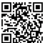
登録料優待制度の お申込み方法