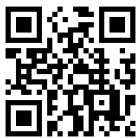
しずおかマリッジ トップページ