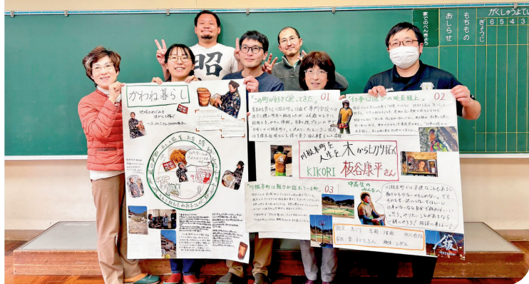
ワークショップで掘り起こした「このまちいいね」を掲げる参加者たち

まちづくりのカギを握るのは、この町にしかない、この町ならではの魅力（川根本町らしさ）。講師は、すでに世に出ている王道の魅力ではなく、まだ世に出ていないディープな魅力にスポットライトを当てていくことで、魅力が溢れどどんと面白いまちになっていくと話しました。 講座に参加した町民をはじめとする24名は、周囲とコミュニケーションをとりながら町のディープな魅力の掘り起こしを行い、それを魅せるところまでの行程をワークショップで体験しました。