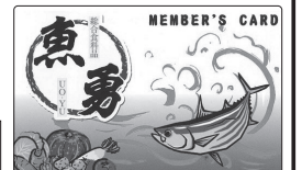
◆魚勇プリペイドカード

皆さまのご近所に「移動手段がなく当店にご来店できない」など、お買い物にお困りの方がいらしたら、ぜひ一緒にご連絡いただければ助かります。その際、引率の方へお分割引券を連発させていただきます。