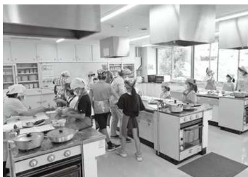
子どもたちと一緒にカレーを作っています！

（注意事項）入会される方は、会費として2,000円/年を納めていただきます。（研修会の材料費等に使用します）その他、エプロン等購入していただくものがあります。