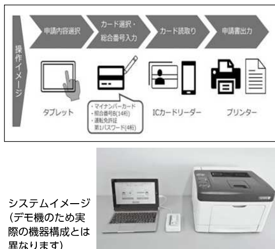
システムイメージ (デモ機のため実際の機器構成とは異なります)

所・生年月日）を自動で印字するシステムの導入を進めています。稼働開始は令和6年2月上旬を予定しています。情報端末の操作に不慣れな方は窓口職員がサポートしますので、ぜひご利用ください。