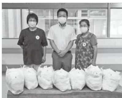
手作りのウエスを配布 ▶