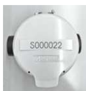
↑水道メーターの蓋をあけて、