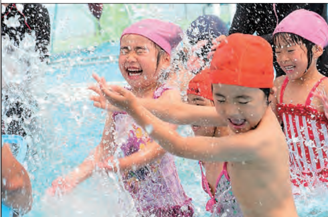
バケツに水をためるゲーム。楽しみながら水に慣れる。

初回では、まずは「水を怖がらないこと」をテーマに、それぞれの年代に応じて設定されたプログラムを満喫しました。