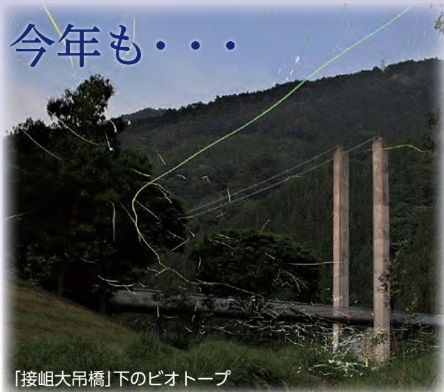
「接岨大吊橋」下のビオトープ

「接岨大吊橋」下のビオトープでは、今年も多くの見物客が訪れ、幻想的な風景を楽しんでいました。昨年からの見物客の増加を受け、長島ダム管理所や町観光商工課により駐車場案内看板や階段、足元を照らす電灯などが整備されたほか、地元住民が見物客を案内するなど、地域ぐるみのおもてなしが見られました。