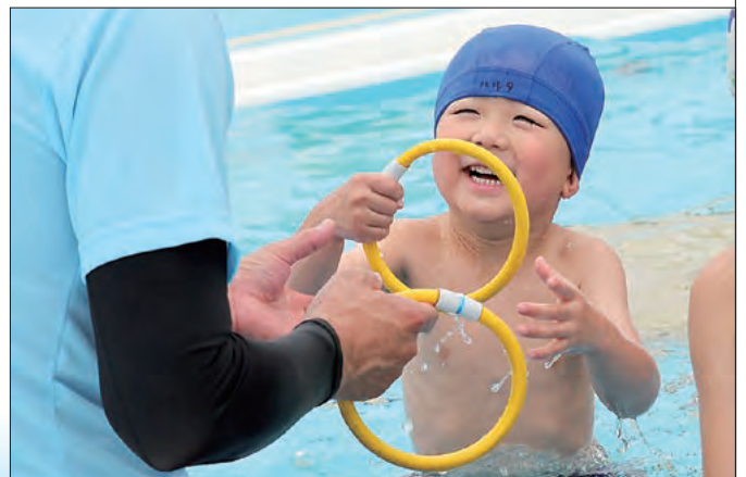
底に沈めた輪を拾う運動。達成感を味わいながら次の段階へ。