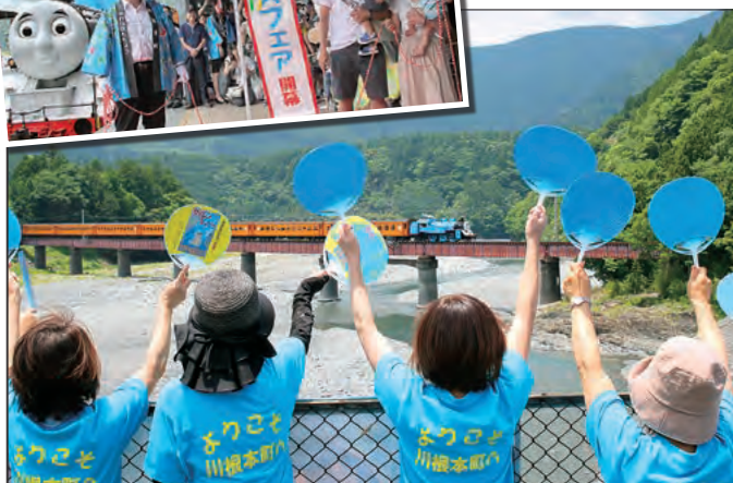
今後は、7月29日・8月26日・9月30日・10月9日に行う予定。