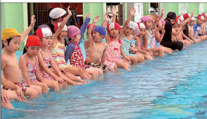
年長組は大プールに挑戦。水の深さを自分自身の体で覚える。