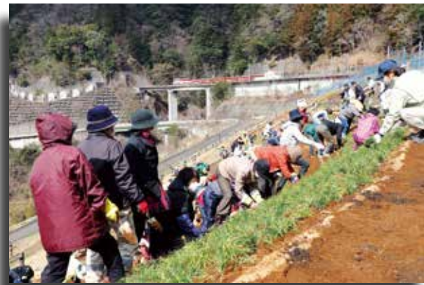
●参加者はグループに分かれ6種類の苗を植栽しました

焼津市から参加した女性3人のグループは「以前植えたシバザクラはシカに食べられてしまって残念。今度は食べられないことを祈りたい」と話しました。