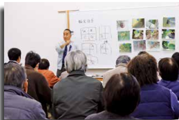
●当日は30人の定員をオーバーするほどの人気に