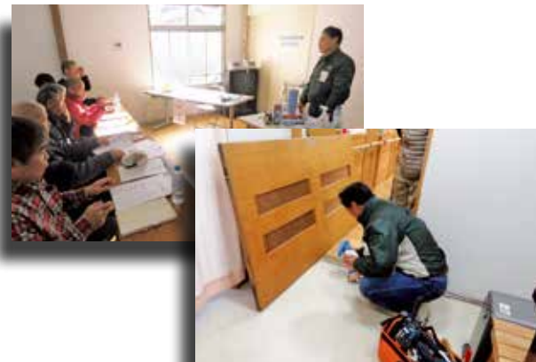
●座学と実地を組み合わせた講座となりました

参加者の方からは「身近なことを教えていただき参考になった」「生活や支援サポート活動に役立つ」などの感想が聞かれました。