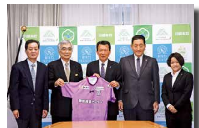
●選手のサイン入りのユニフォームが送られました