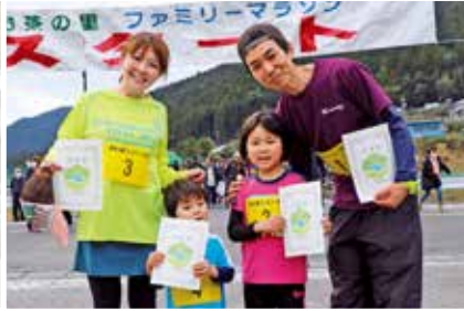
3kmおよび5kmの部 上位入賞者記録