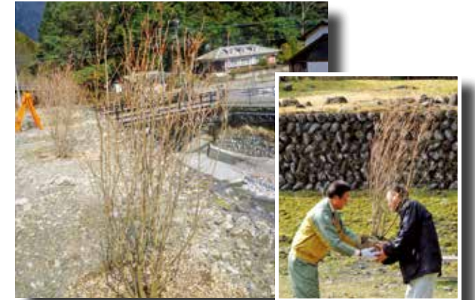
●成長後にはツツジがカジカ沢沿いを美しく彩ります