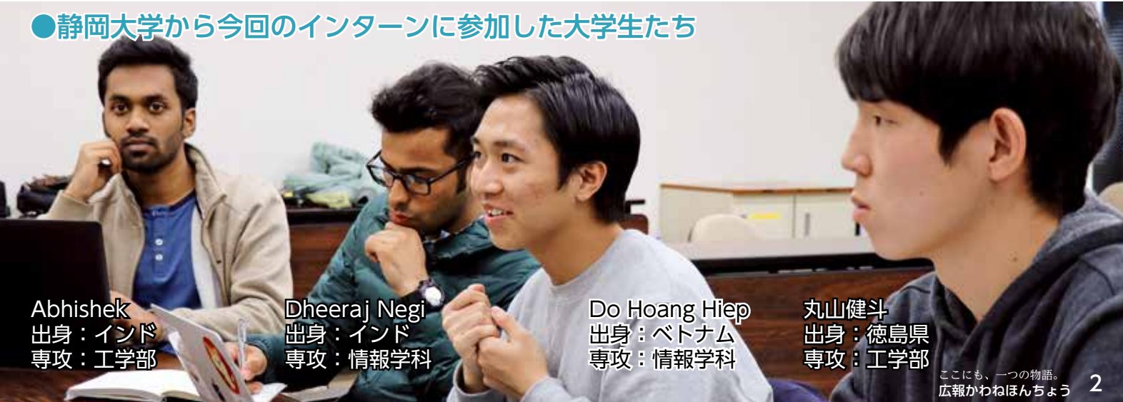
●静岡大学から今回のインターンに参加した大学生たち

手振りを交えて教えてくれたのでよかった」と感想を語りました。 2月26日には町の担当者から本町の現状や抱える問題点についての聞き取りを実施。大学生というだけでなく、海外からの視点という留学生ならではの考え方で解決策を模索、町へ提案するグループワークが行われました。 3月1日に行われた成果発表会では、同席したゾーホー・ジャパンの社長から「よくできた提案内容」としてインターン最終日に横浜の本社で全社員向けにも発表を行うことになったほか、「町の幹部職員の方にもこの内容を共有してもらいたい」との依頼がありました。 ▼インターン生たちは以下の3点をテーマにして提案を作成しました。 ● 地元の人々と自治体と企業の協力で川根本町における過疎課題を解決すること ● 地域への関心を子どもにも与えるコミュニティを築くこと ● 経済的に自立できるコミュニティを築くこと ※左のページに提案内容を抜粋してまとめましたので、ご覧ください。