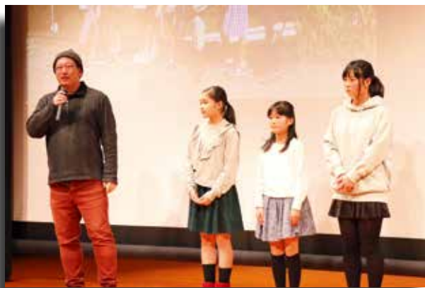
●トークショーには監督のほか出演者も参加しました

また、上映終了後にはウンノヨウジ監督によるトークショーが行われ、大盛況の上映会となりました。