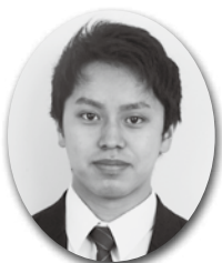
32 HR 又平 一央

した。先生方や家族の支えがあったからこそ、本番でも力を発揮することができ、内定をいただくことができたので、感謝しています。 就職したらゼロからのスタートになります。社会人として壁にぶつかった時は、高校3年間で培った協調性や忍耐力を生かし、手を抜かず努力することを思い出して乗り越えていきたいです。そして、川根本町の今まで気付かなかった新しい良さを見つけ、誠心誠意尽くしていけるよう頑張ります。