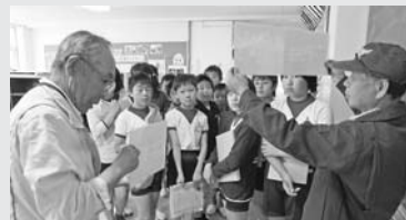
昨年、中川根第一小では「ホタルの飼育」に挑戦した。「地元の自慢を、自分たちの手で育ててみたい」と取り組んだもの。ホタルを育てる会のメンバーが講師となり、飼育方法などを学んだ。

は「昔は捕まえるほどたくさんいたのに、やっぱり環境が変わっちゃったんだねえ。これからも頑張ってもらいたいねえ」と話しながら帰っていった。たくさん地域住民が来場し、鑑賞会は成功に終わった。そして参加者の中からは、この取り組みを見守り、応援していきたいという声も聞かれていた。ここにも、育ちつつある心があつた。