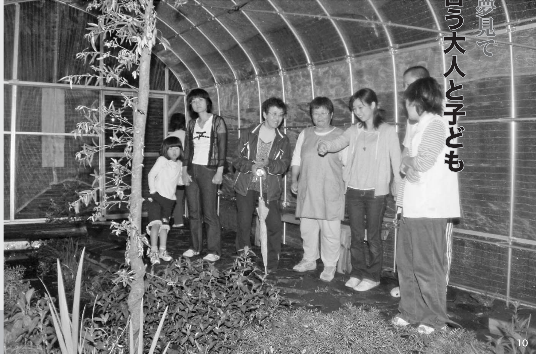
地区内外から大勢の人が参加したホタル鑑賞会。大人も子どもも関係なく、幻想的な光に心躍らせた。

「きれいだねえ、かわいいねえ」と昔を懐かしむように光を見つめる大人たち。「ホタルがわたしの手にとまったよ。どうしよう」と、そこから動けなくなる子どもたち。感動する心に、大人も子どもも関係ない。参加者全員が、ほのかな光の筋に見入ったままだ。