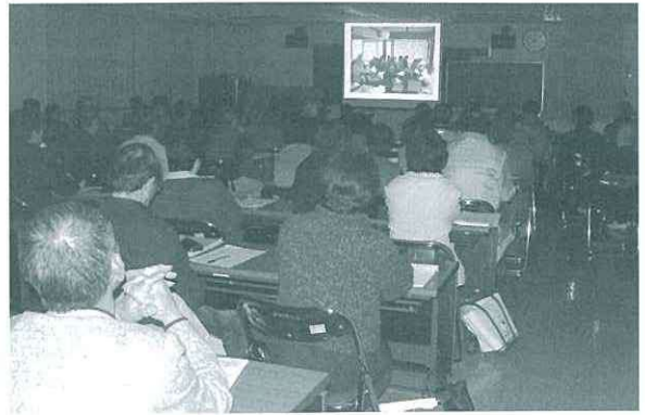
スライドなどで取り組みを発表し、情報を交換しました

生涯学習の1年間の取り組みをまとめた「地域で取り組む生涯学習 特集号」を、後日、各ご家庭に配布する予定です。