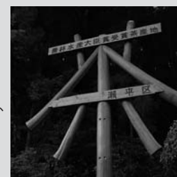
活動例左写真から／川根茶モニュメント(瀬平)、広報紙発行(徳山)、シバザクラ植栽作業(久野脇)

農地・水・環境保全向上対策事業の協定を交わし活動中の町内5団体 本事業の採択を受けたことで、どんな効果が生まれたのか これからどんな地域をはぐくんでいきたいのか 各団体の会長に「本事業が地域にもたらした効果」について聞いた