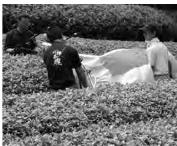
▲日光を完全に遮断し光合成を止めることで、茶葉の色が白黄色になるのが特徴の白葉茶

白葉茶は、日光を完全に遮断し光合成を止めることで、茶葉の色が白黄色になり、茶のうま味成分であるアミノ酸含有量が約3倍になります。県農林技術研究所茶業研究センター(菊川市)が中心となり栽培技術を開発、榛南や他地域でも試験栽培が進められています。茶業振興協議会はリーフ茶の消費伸び悩みや茶価低迷を打開し、川根茶に新