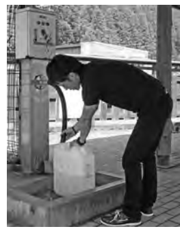
▲ポタン1回で約20ℓの温泉が出ます