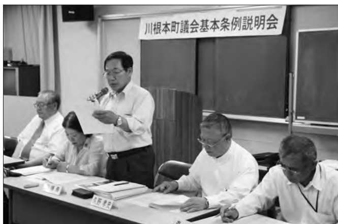
議会基本条例について分かりやすく説明する議員の皆さん

条例素案について策定の経過説明と内容に関する解説がされると、出席した町民から条例素案の具体的な内容やこれからの計画などについて積極的な質問がありました。