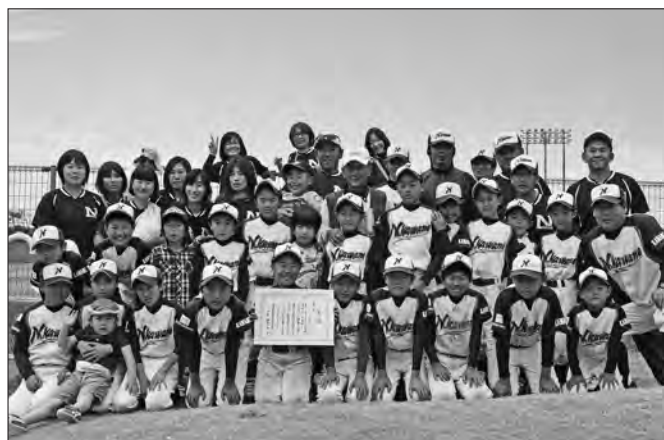
「これから参加する大会でも頑張りたい」と選手たち