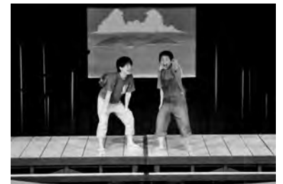
小学校5年生の大和が目指す島に…