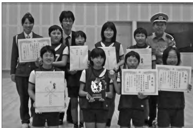
団体の部で優秀賞に輝いた南部小Aチーム