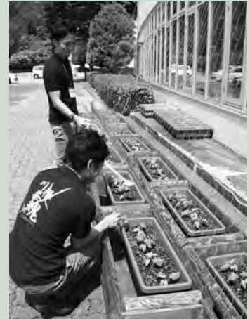
◀8月には涼しげなカーテンになります。