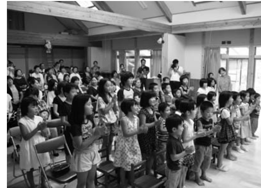
▲元気に歌に合わせて手をたたく園児

さゆり幼稚園で8月27日、園児と保護者約80人が参加して、「親子コンサート」(同園子育て支援事業)を開催した。参加者は、童謡など23曲の伸びやかな歌声に聞き入り、拍手を送っていた。