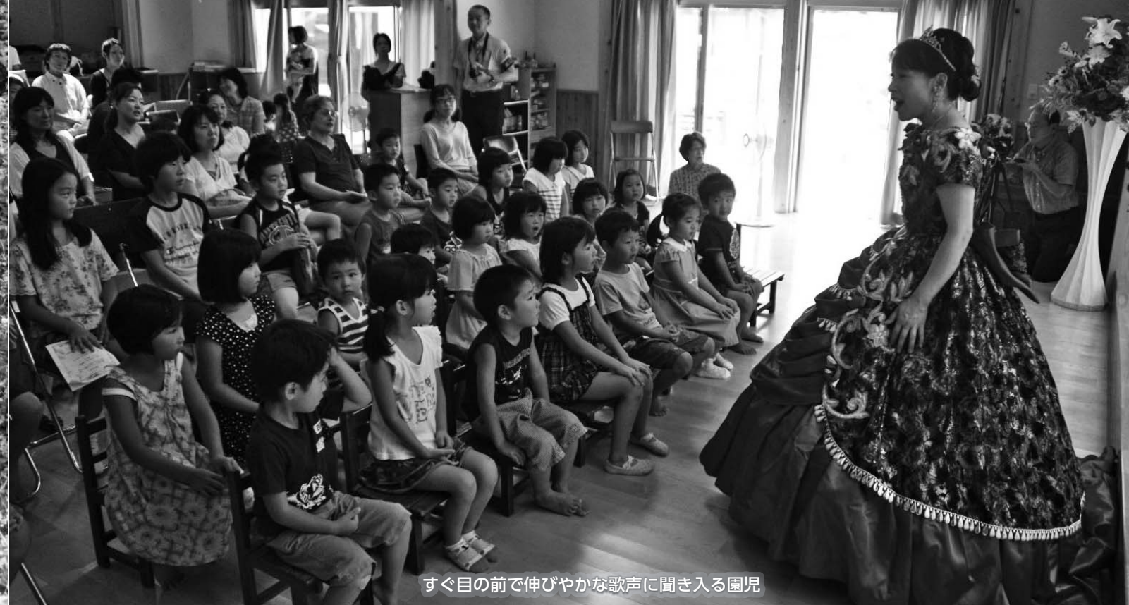
すぐ目の前で伸びやかな歌声に聞き入る園児