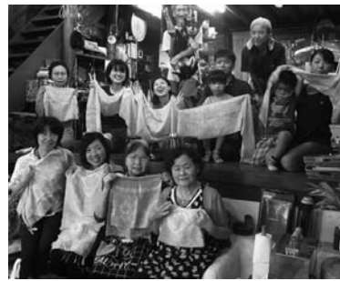
夏らしいインディゴブルーのスカーフ(藍の生葉染め体験)

さて、10月はイベントシーズン突入！プログラムは毎週末ごとにあり、大忙しの予感です。情報はブログや回覧板などで発信していきますので、皆さんもぜひご参加ください！