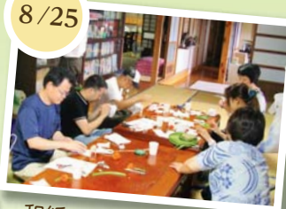
和紙であかりを作った。