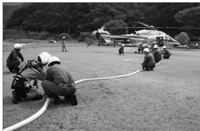
ホースをつなぎ、大井川からポンプアップして、消火タンクに給水

訓練では2・3・4分団が、「ヘリ誘導」「給水訓練」「見取り」を交互に分担し、生涯スポーツ広場で県消防防災ヘリコプターの消火タンクに給水して連携方法を確認。その後、文化会館ホールで活動上の注意事項などを学びました。