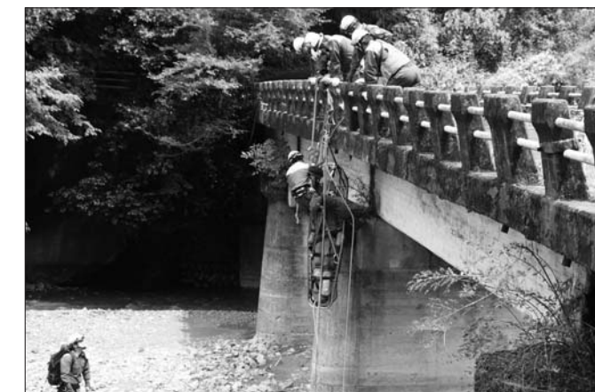
川底から要救助者を引き揚げる訓練(榛原川)

近年の登山ブームにより、町内でもハイキングや登山客が増加していることから、不測の事態に備えて日々訓練を行い、各隊員の災害対応能力の向上と体制の強化を目指しています。