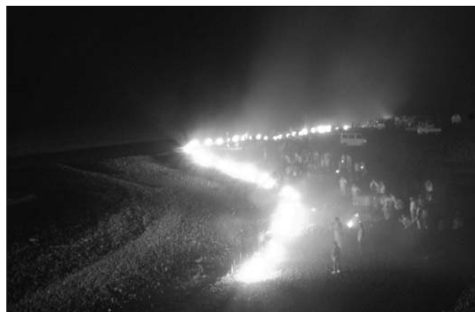
下泉橋から臨む「百八たい」、闇夜に赤く燃え上がった

「百八たい」の由来は、下長尾区に昔から行われてきた儀式で、起源は江戸期に発生した鉄砲水の犠牲者を慰霊する川施餓鬼であったとも伝えられていますが定かではなく、現在の形式になったのは昭和50年代からとのこと。