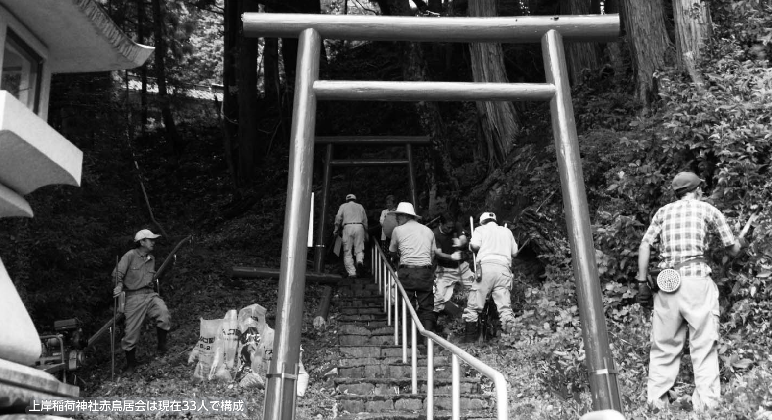
上岸稲荷神社赤鳥居会は現在33人で構成