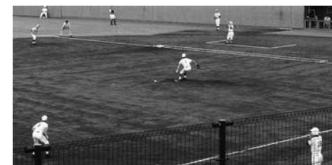
小山高校と対戦し、結果は最終回の追い上げ届かず、惜しくも2対3で初戦敗退。応援にも力が入り、全員・全力野球でみんな力を尽くしました。(清水庵原球場)