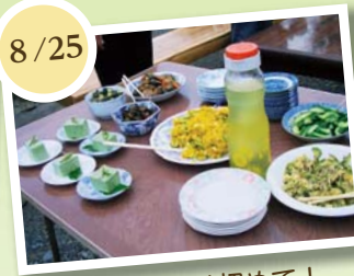
お茶豆腐は初めて！