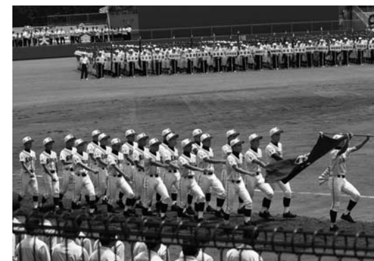
気合いを入れて入場行進 (島田球場)

野 球部はすでに新しいチームとなり、二年生を中心に活動しています。これからも変わらず、皆様方のご声援をよろしく願います。