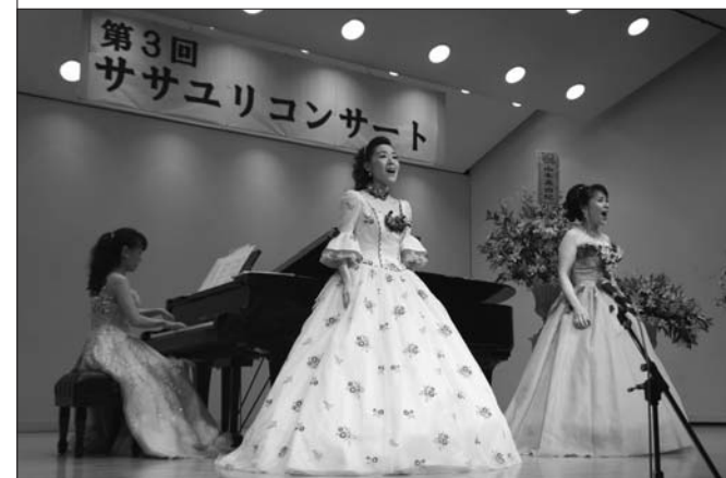
個性豊かな3人の演出も見どころだったコンサート

このコンサートは「川根地区の子どもたちに本物の音楽に触れる機会を作りたい。大人の楽しみ・娯楽の場を作りたい」と考え、始めたコンサートで、今年で3回目の開催です。