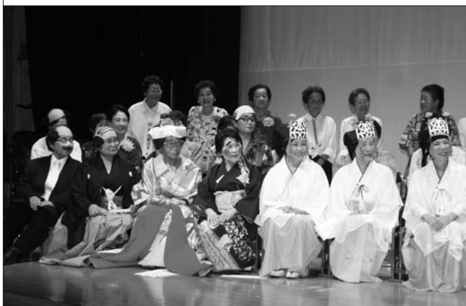
笑い声が絶えない演芸会になりました♪

3地区の生涯学習委員が「文化会館ホールで歌や踊りを一度はやってみたい、元気を出したい!」という出演者を募集し、企画しました。お子さんからお年寄りまで、多くの芸達者が集まり、楽しく和やかに開催されました。