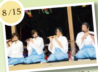
盆踊りの笛吹きに挑戦！