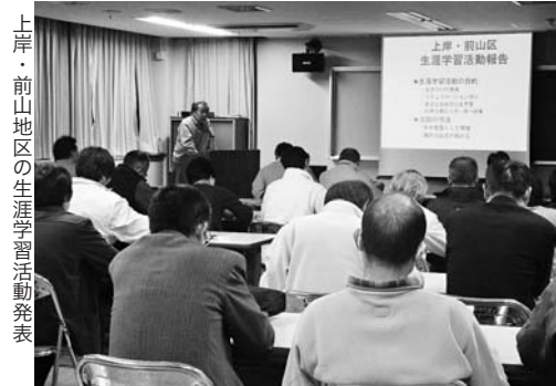
上岸・前山地区の生涯学習活動発表

先進地視察研修報告 桑野山区推進員 取り組み報告 上岸・前山、坂京、梅高地区推進員 なお後日、「地域で取り組む生涯学習広報誌」を、各戸配布する予定です。