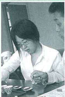
「お茶の淹れ方教室」に参加しました

みなさん、今度ご自宅で、お茶を入れてもらうとき、また、お茶を入れてあげるとき、急須の中をまじまじと見てみるのはいかがですか？