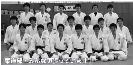
柔道部・みんな頑張っています！