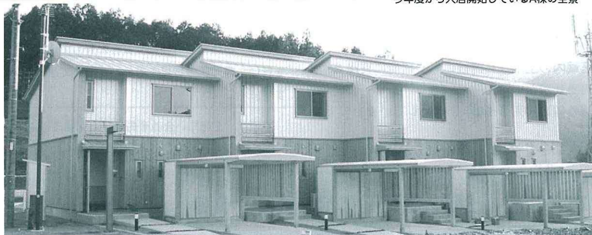
今年度から入居開始しているA棟の全景

問い合わせ：川根本町役場建設課管理係 榛原郡川根本町上長尾627 ☎ 0547 (56) 2227