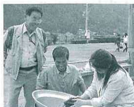
9/30 フォーレなかかわね茶老館を会場に第3回川根茶塾を開催 塾生は茶手揉み保存会の方々を講師に秋冷茶の手揉み・釜炒り茶を体験しました