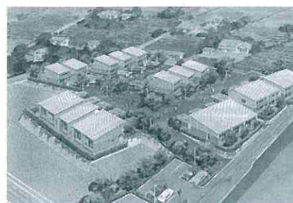
若者定住促進住宅の完成予想図

地域の活力の基となる若者に川根本町の定住を促進するため、「若者を迎え入れる住まいづくり」の考えのもと、建築材・デザイン・景観・環境に配慮した「若者定住促進住宅」の入居者を募集します。