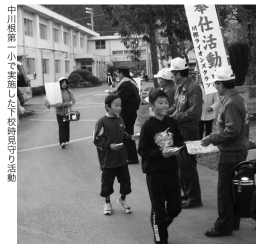
中川根第一小で実施した下校時見守り活動