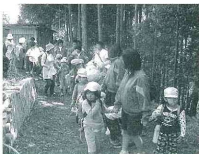
貴重な体験ができました

で可愛いなと思いました。私にとってこの実習は、普段接する機会がない園児たちから多くのことを学べたこと、実践を通して本当によかったと思いました。そして、そこから感じたたくさんのことを大切に、自分が将来親になった時、自分の子どもとどう接していくのかを考えていきたいと思