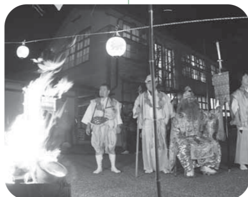
漆黒の闇に炎が立ち上ります