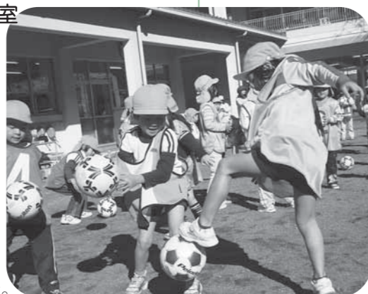
足でボールを扱うのって難しい！

この「キッズ巡回指導・キッズクリニック」は、6歳以下の子どもを対象として、身体を動かすことの爽快感を体感してもらいながら、サッカーの普及などを図るプログラム「JFAキッズプログラム」を推進するもので、桜保育園で行われた午前部の部に参加したのは桜保育園、藤川保育園、三ツ星保育園の年長児33人です。Jリーグジュビロ磐田のプロコーチ3人の指導のもと、ドリブルをしながらの鬼ごっこや、2人で手をつなぎ相手を思いやりながらのドリブルシュートなど、楽しく元気良く体を動かし、たくさん笑顔を見せていました。