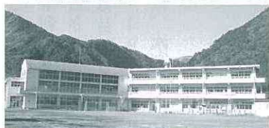
写真：北小学校、校舎内・体育館・外観