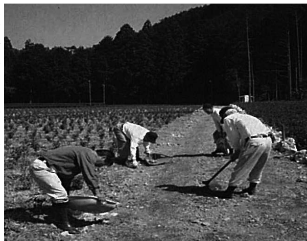
農道の路面清掃・穴埋め作業

どんな活動を中心として、どんな人たちがかわり合って取り組んでいるのか各団体の概要を紹介する。