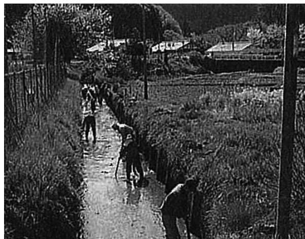
用水路の泥上げ作業

◀久野脇水と緑の会がクリーンビュー川根横の道路のり面に植栽したシバザクラ。春先には、ピンクと白に彩られた見事なじゅうたんが姿を現している。