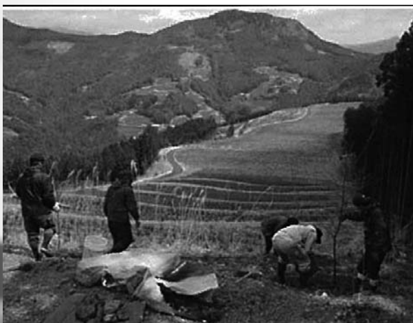
景観形成のための植栽作業