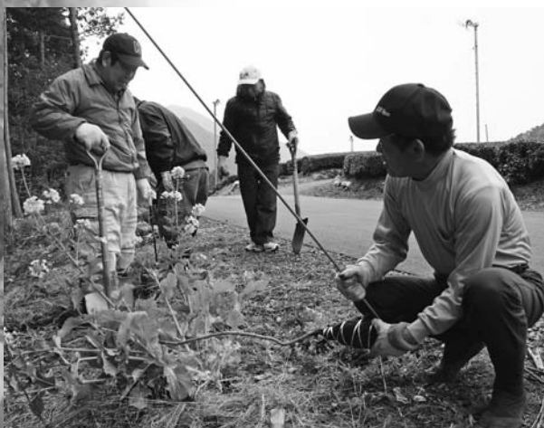
農道脇に植栽活動