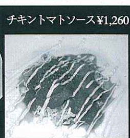
チキントマトソース ¥1,260