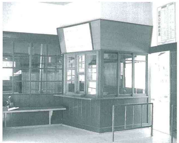
これまで板張りであったところも窓ガラスに戻され、昔ながらの駅風景が復元されています（田野口駅駅舎内）

今回の改装で、開業当時の雰囲気再現しようと、切符売り場や小荷物取り扱い窓口を復元したほか、壁の塗装も木調の茶色に統一されています。