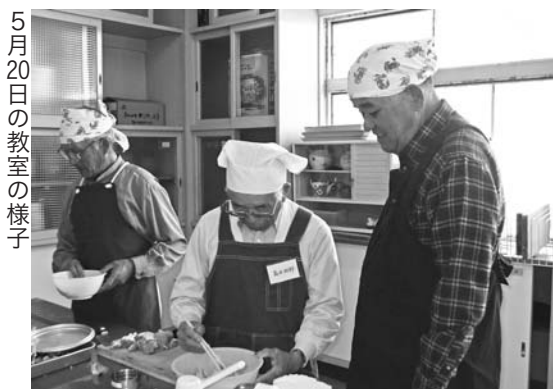
5月20日の教室の様子