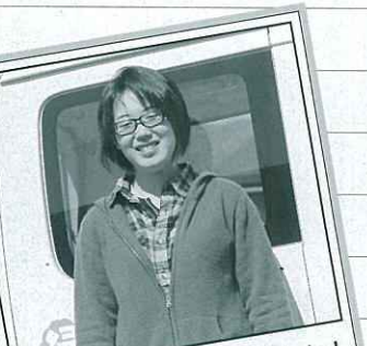
みなさんお世話になりました！