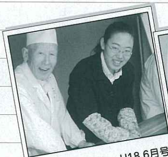
広報に初登場！ H18.6月号

いんだなあと思える場所をつくってくれてありがとう。私が何をしようがしまいが、いつも同じ態度で見守っていてくれてありがとう。突然のわがままにつきあって