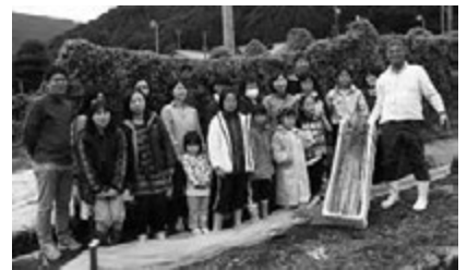
大きな自然薯を収穫して大満足の参加者たち

「また来いや〜」「また来るよ〜」そんな会話があちこちで聞かれました。参加した人たちは川根本町のファンになって、きつとまた戻ってきてくれるでしょう。そして私は今日も“達人”を探して町内を駆け巡ります。