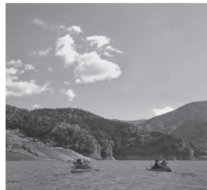
4月～11月の8か月で、225名の方がカヤックプログラムに参加してくださいました(接岨湖にて)

観光というジャンルにおいては、小さな動きかもしれませんが、エコツアーは確実に前進し発展しています。町民の皆さんには引き続き、関心を持って応援していただきたいです。