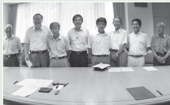
右側：久野脇「水と緑の会」 左側：地名「やらざあ会」

近年、集落全体の高齢化が進み、担い手不足で荒廃農地が増えつつあります。今後、この2団体をモデルケースとし、地域が一体となり農地・農業用水、また農村環境の良質な保全管理の推進を図り、ゆくゆくは町全体の活動につながっていくことが期待されています。