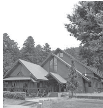
ウッドハウスおろくぼ