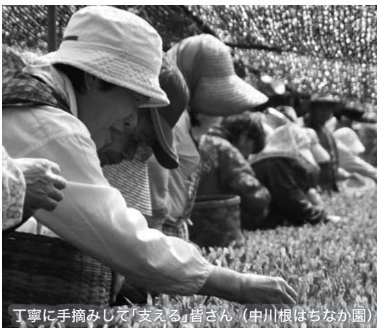
丁寧に手摘みして「支える」皆さん(中川根はちなか園)