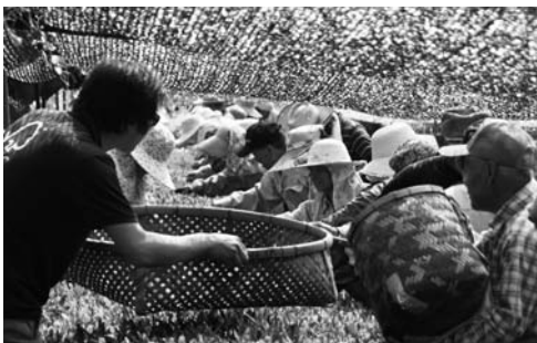
葉がつぶれたり、蒸れないように30分おきに葉を回収