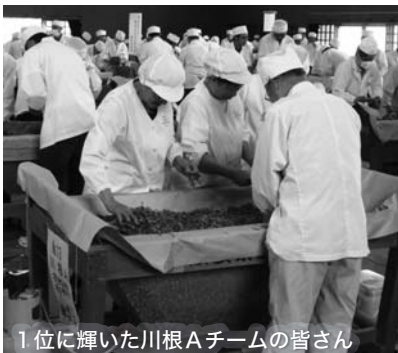
1位に輝いた川根Aチームの皆さん