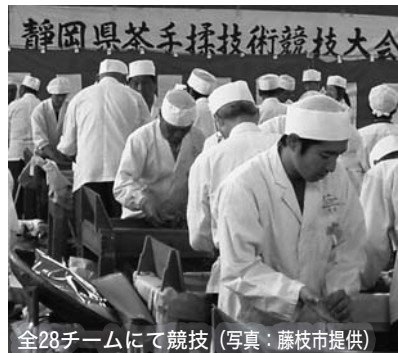
全28チームにて競技