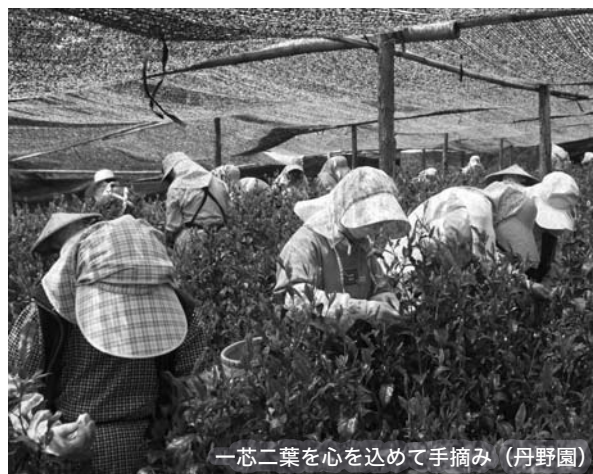
一芯二葉を心を込めて手摘み(丹野園)