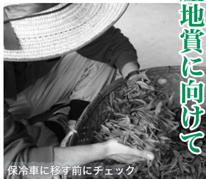
保冷車に移す前にチェック