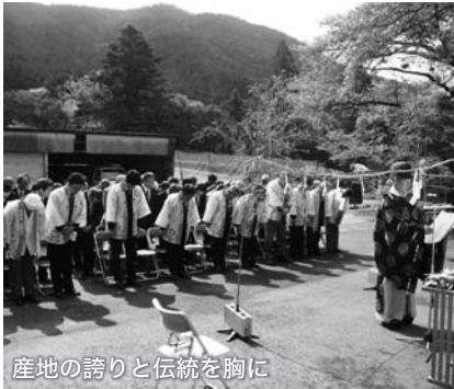
産地の誇りと伝統を胸に

は安全・安心であるということが証明されました。お客様にこの地域に来ていただく、お茶どころというものを知っていただく取組みをしていきたい。お茶の発展が町の発展、地域づくりにつながっていきます」とあいさつをしました。