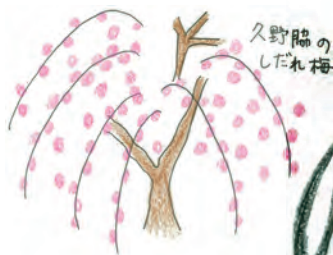
久野臨の しだれ梅

Last Heartful Message 鹿児島に帰っても 川根本町のことを発信し続けます!