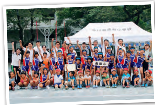
▲中川根南部小学校