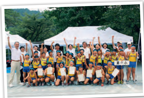
▲中川根第一小学校