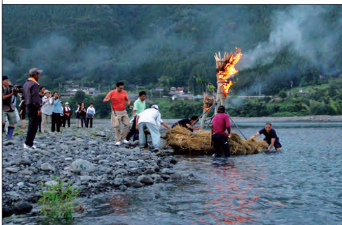
「たい」は皆が見守る中、大井川に流して奉納されました