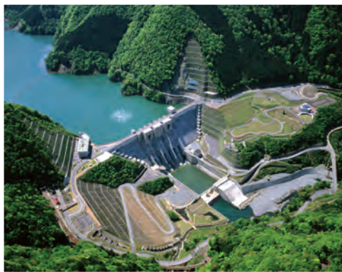
長島ダム空撮写真