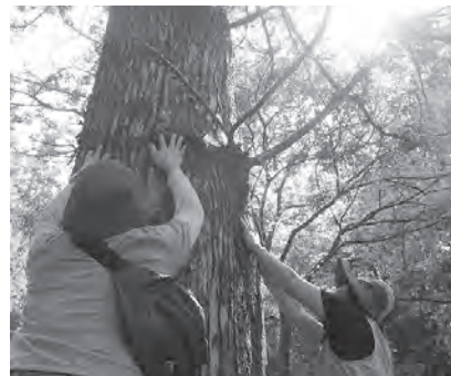
巨木に抱きついたり触れたりすることで、木の生命力を感じます

お客様は温泉で、食で、森で癒され、最終的には「人」に癒されて帰っていきます。この森林療法ツアーをもっと普及させて、川根本町が本当の意味での「癒しの里」になることを目指します。