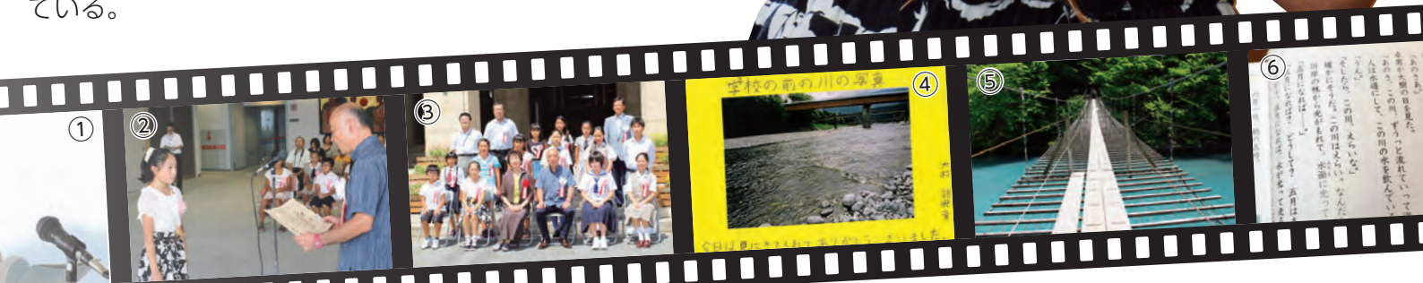
①知事賞作品の朗読、②池谷廣くらし・環境部長から賞状を受ける、③受賞者記念撮影、④調べ学習、⑤作文中にある「夢の吊橋」、⑥作文中にある「この川、えらいな」