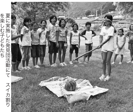
夏に実施した発見団活動にて、スイカ割りを楽しむ子どもたち