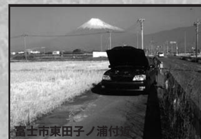
富士市東田子ノ浦付

川根本町上長尾795-1 I P 電話 ☎050-3363-2252 ☎56-0006 ☎56-0009