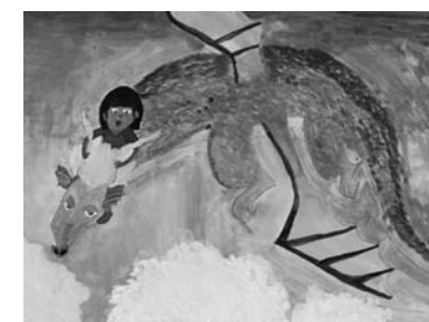
題名 ヒックとドラゴン⑤灼熱の予言