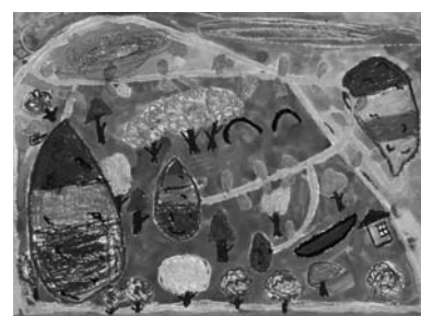
題名 いもほりやま