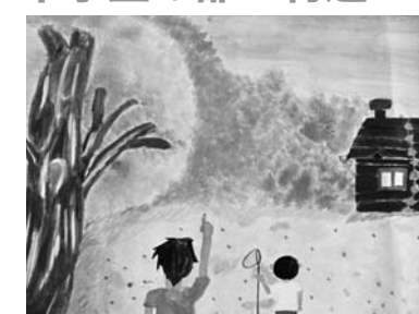
題名 ヘヴリープレイス