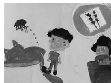
題名 これはのみのぴこ