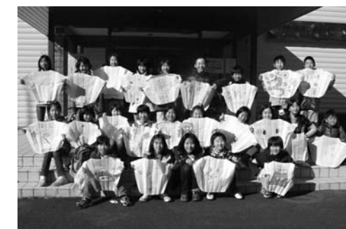
できあがったこと記念撮影

ふるさと発見団第4回は1月14日、資料館やまびこで開催されました。本年度最後となる本学習会では「昔の正月遊びをしよう」をテーマに、たこ揚げを楽しみました。参加した子どもたちは、それぞれのたこに好きな絵を描き、完成後は外へ移動。適度な風が吹き、たこを高く揚げることができました。木に引っかかり、糸が絡まったりする場面もありましたが、それでも子どもたちは元気の顔からも笑顔があふれました。