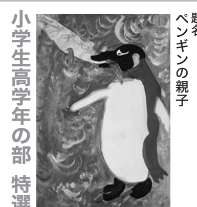
題名 ペンギンの親子