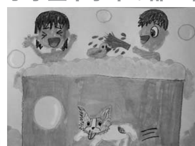
題名 3にん4きやくイヌ1ぴき