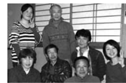
私たちと一緒に出かけよう

川根本町エコツーリズムネットワーク 「本町のお山々を多くの人々に楽しんでほしい」を目的に、本町エコツーリズムネットワークでは、地元ガイドを中心に、年間通じてトレッキングツアーを実施しています。3月25日のツアーでは「ガイド養成・ガイド技術向上」のため、町内向けのトレッキングツアーを実施します。トレッキングが好きな人、自然が好きな人、ガイドに興味がある人など、ぜひご参加ください。 実施日 3月25日(日) (雨天中止) コース 雨乞いと学業の神社・智者山の山頂からの大井川と南に開ける眺望や、七ッ峰、富士山一帯の眺望、天狗石山反射板展望所からの眺望を楽しむコース。午後は山岳ガイドによるファーストエイド講習(救急法)を体験。 参加費 保険代500円 定員 20人(ガイドあわせて25人) 締切 3月18日(日)正午(先着順) 持ち物 弁当、水筒、ハイキングができる服装・靴、帽子、雨具、タオル 【申・問】 川根本町エコツーリズムネットワーク ☎(59) 2746 http://honkawane.ooi-alps.jp/ ※申し込みの際は①氏名②性別③生年月日④住所⑤電話番号⑥参加希望プログラム名をお伝えください。