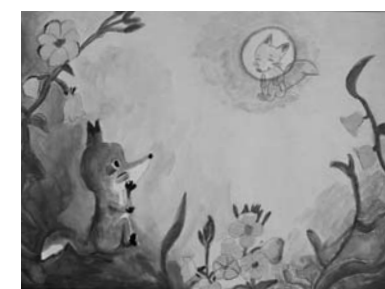
題名 ぎつねとつきみそう