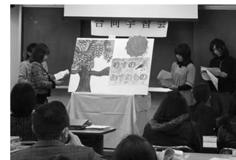
中川根第一小の家庭教育学級生による発表

家庭教育学級合同研修会・閉講式は2月5日、山村開発センターで開かれました。本年度の家庭教育学級では「親子で取り組む読書活動」を共通の活動として、家庭の中の読書習慣の定着を目指して活動してきました。