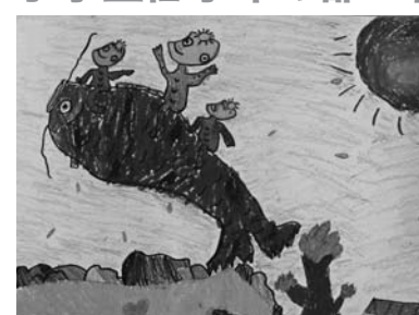
題名 がっこうかっぱのイケノオイ