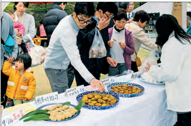
家族連れらに「川根茶」を使った料理を振る舞う