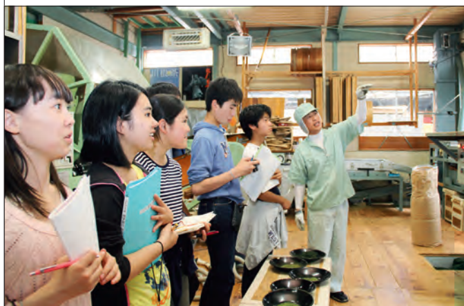
製茶用の機械の迫力に驚く生徒たち

筑波大学附属中学校(東京都)3年生40人が、修学旅行のプログラムの一環として町内の数カ所の茶農家や共同茶工場を訪問しました。