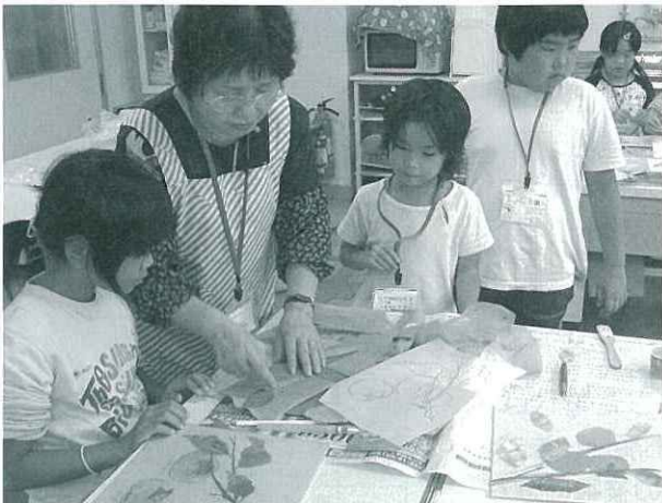
地域の方に教えてもらうことはいつも新鮮に感じます