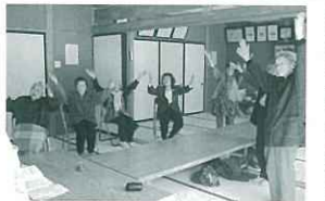
みんなで楽しく歌いながら体操しています