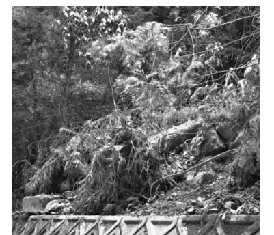
土砂災害から身を守るため、日ごろから危険な箇所を確認しておきましょう

日ごろから家の周りなどの危険箇所の状態に注意しておきましょう。また避難場所や安全な避難経路の確認も重要です。いざという時、速やかに避難できるように心がけましょう。