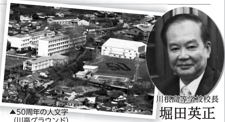
▲50周年の人文字 (川高グラウンド)

【主な進路先をご紹介します】(3月1日現在) 【国公立大学】茨城大学理学部、静岡大学工学部、静岡大学 教育学部、都留文科大、静岡県立大学短期大学部(看護) 【私立大学】常葉大学保育学部、帝京大学文学部、静岡産業 大学経営学部、静岡英和学院大学短期大学部(食物)、聖隷 クリスチャー大学リハビリテーション学部など 【専門学校】大原簿記情報医療専門学校、東海福祉専門学 校、静岡福祉医療専門学校、静岡工科自動車大学など 【就 職】J A大井川、川根本町役場、中部電力、大井川 電機製作所、特種東海製紙株式会社、トヨタ自動車、中島 屋ホテル、あかいしの郷など