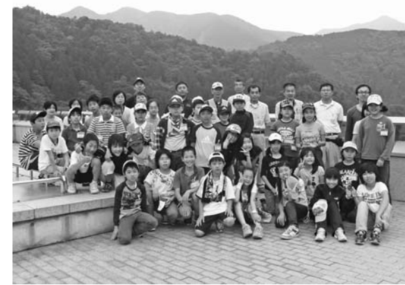
長島ダムで記念撮影

「(しいたけの)菌打ちは初めての体験。どきどきしたけど面白かった」「初めてのカメラがとても楽しかった」「音戯の郷というだけあって、色々な音を聞くことができた」「違う学校の子と友だちになれてうれしかった」などの感想が聞かれました。