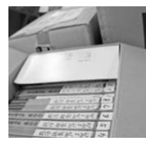
段ボール6箱に収められたスクラップ。政治社会・スポーツなど、見やすく分類されている。