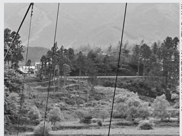
道からの見晴らしが大幅に改善されました

平成21年度は塩郷の吊り橋（愛称：恋金橋）右岸側の竹林などを整備。これにより吊り橋付近の景観は向上し、遊歩道から大井川や塩郷堰堤への見晴らしも良くなりました。同組合では平成20年度に本川根中学校周辺の森林を整備し、本年度は下泉区（横郷）の竹林整備を計画。継続的に景観向上に取り組んでいます。