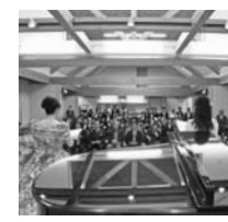
耐震化を施した新園舎が今年3月完成。記念して開かれたコンサートには大勢の人が詰めかけた