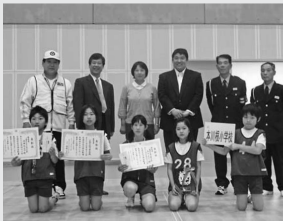
見事なチームワーク。団体の部優秀賞を受賞しました