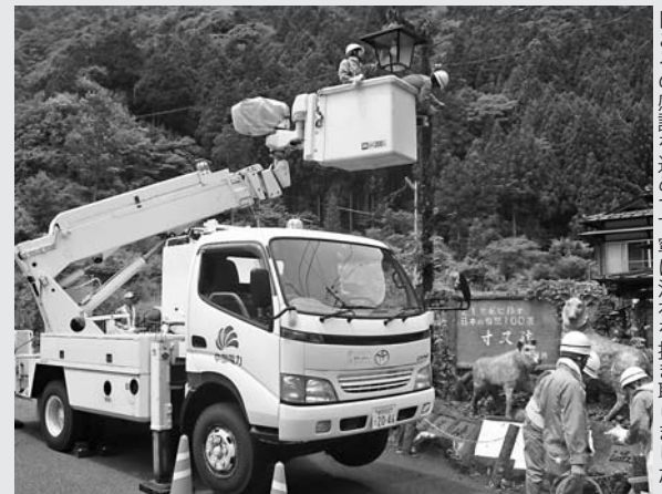
日ごろの感謝を込めて丁寧に汚れを拭き取りました

本町商工会第1支部は6月9日、中部電力(株)大井川電力センターと共同で、寸又峡温泉の街路灯の清掃作業を実施。16人が参加しました。両者の「寸又峡に訪れる観光客を明るく迎えたい」「地域に貢献したい」などの思いが結び付いて実現したもの。高所作業車に高所作業専門職員が乗り、感謝の気持ちを込めて1年間の汚れを落としました。丸一日かけて、26基すべてを清掃。街路灯は本来の美しさを取り戻しました。