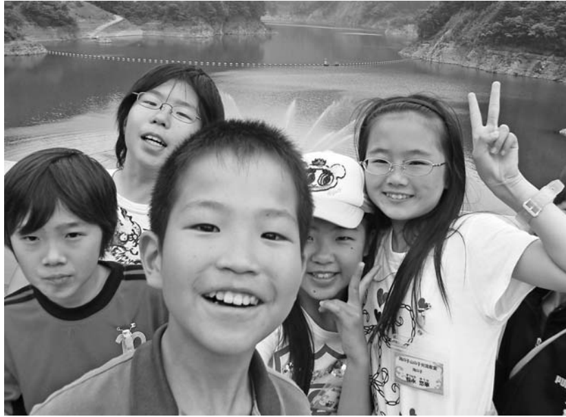
子どもたちのほじける笑顔

海の子・山の子交流教室「山の体験」は5月22から23日実施され、本町の小学5、6年生7人と、焼津市の小学5、6年生22人が参加しました。