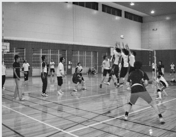
ネット前の攻防が白熱していました