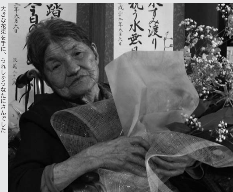
大きな花束を手に、うれしそうなたにさんでした