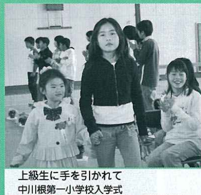
上級生に手を引かれて 中川根第一小学校入学式