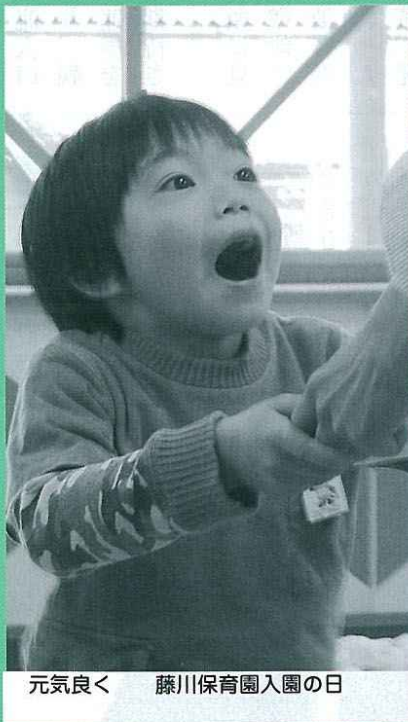
元気良く 藤川保育園入園の日