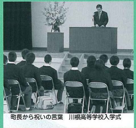
町長から祝いの言葉 川根高等学校入学式

「特集」卒業と入学 ～それぞれの旅立ちと出会いのとき～ 今回、特集を組むに当たって、 町内各幼稚園、保育園、学校関 係者のみなさんにご協力いた だきました。 ありがとうございました。