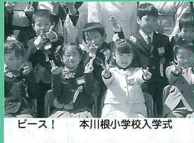
ピース！ 本川根小学校入学式