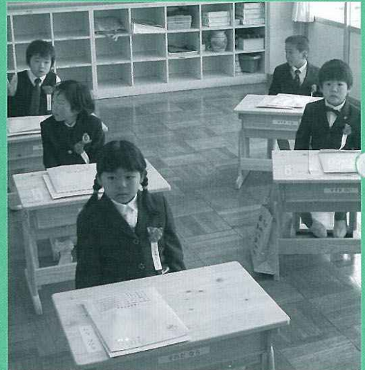
少し緊張気味の顔 中央小学校入学式

平成19年度入園・入学生数 学校法人さゆり幼稚園 9人 町立桜保育園 41人 町立藤川保育園 13人 町立三ツ星保育園 56人 私立徳山聖母保育園 33人 町立本川根小学校 20人 町立中川根第一小学校 17人 町立中央小学校 12人 町立中川根南部小学校 12人 町立本川根中学校 27人 町立中川根中学校 42人 県立川根高等学校 72人 保育園は園児全体の人数です。 (園児全員が入園扱いのため)