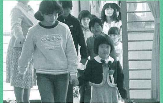
手を引かれて入場 中川根南部小学校入学式

平成19年度入園・入学生数 学校法人さゆり幼稚園 9人 町立桜保育園 41人 町立藤川保育園 13人 町立三ツ星保育園 56人 私立徳山聖母保育園 33人 町立本川根小学校 20人 町立中川根第一小学校 17人 町立中央小学校 12人 町立中川根南部小学校 12人 町立本川根中学校 27人 町立中川根中学校 42人 県立川根高等学校 72人 保育園は園児全体の人数です。 (園児全員が入園扱いのため)