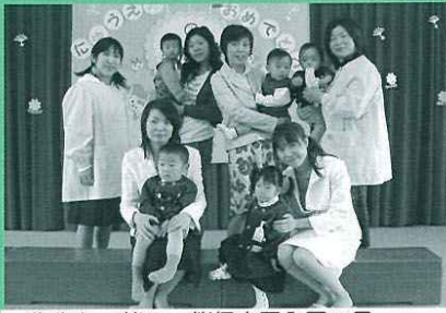
先生と一緒に 桜保育園入園の日