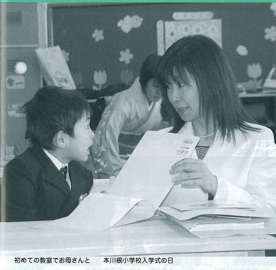
初めての教室でお母さんと