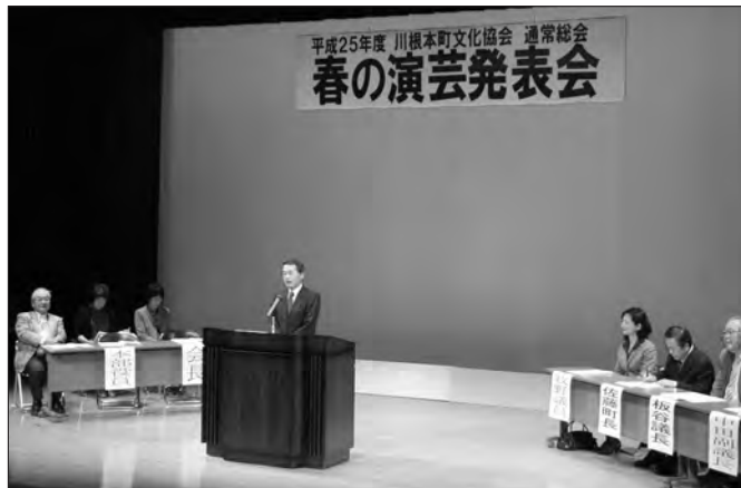
「地域の皆さんに喜んでもらえるように」と話す千澤会長