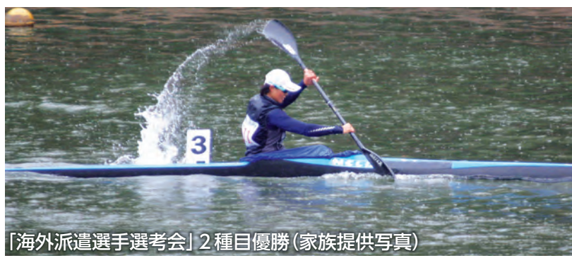
「海外派遣選手選考会」2種目優勝

続 いて出場した200mでも、レースに集中できていきましたが、予選・準決勝とも苦手としているスタートがうまくいきませんでした。決勝は風と波の影響を受けましたが、この状況は「ビビらないもの勝ち」だと感じていたので、気にせず無心でいきました。決勝が一番バシッと決まって、あつという間だったと思えるほどの集中力を発揮できました。冬の間のウエイトトレーニングによる筋力アップや漕ぎの改善、ブラジルで行った短発的なスタートダッシュの練習など、やってきたことが生きたレースだったのではないかなと自分で感じることでできてうれしかったです。しかしタイム自体はかなり遅く、シーズン最初の試合という点を考慮しても、女子全体や自分自身のレベルが低く終わってしまったことが残念です。夏に向けて時間を大切に、より質の高い練習を重ねていこうと思います。 こ の大会結果により改めて今年度の日本代表に選ばれ、7月のユニバーシアードに出場することになりました。この大会は、全