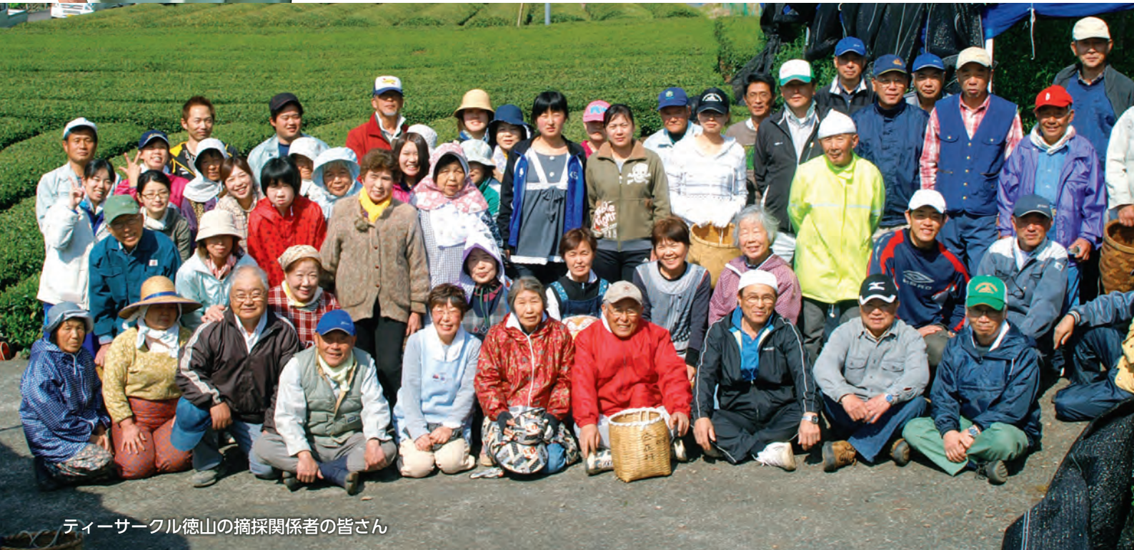
ティーサークル徳山の摘採関係者の皆さん