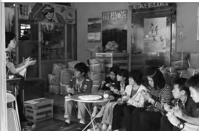
「お茶のパバロア」を食べ、茶スイーツも楽しんだ

その後、実際に茶摘みを体験すると「思っていたより葉や新芽が柔らかくてびっくりした」と笑顔を見せていました。