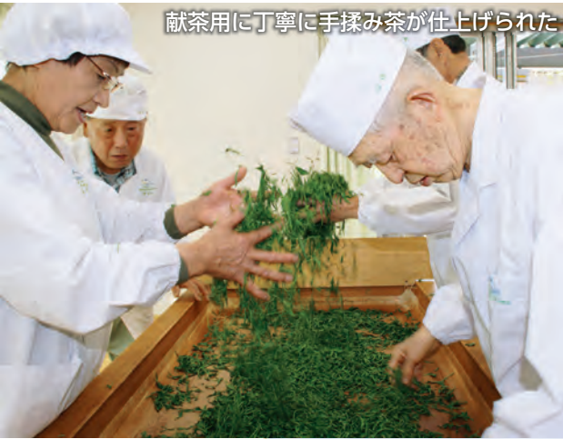
献茶用に丁寧に手揉み茶が仕上げられた