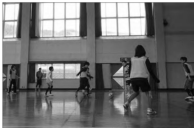
小学生から大人まで混合で楽しんだ

参加者は5チームに分かれ、総当たり戦で試合に臨み、各チームとも協力して勝利を目指しました。好プレーには大きな歓声上がるなど、会場は終始はつらつとした雰囲気にも包まれました。