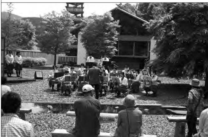
川高生のブラスバンドも初参加、会場を盛り上げた

音戯の郷屋外広場で、音楽でまちを盛り上げようと野外コンサート「カワネ・ミュージックリンク」(主催 こんばんわ会)が開催されました。