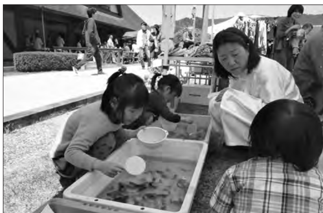
熱心に魚をすくい上げようと頑張る子どもの姿も見られた

今後は偶数月の第4日曜日に定期開催していきたいとのことで、次回は6月23日(日)に実施する予定です。