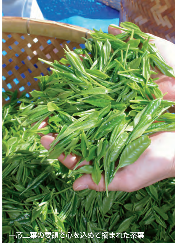
一芯二葉の要領で心を入れて摘まれた茶葉

まさに町を挙げての取り組みと川根茶に対する愛情で素晴らしいお茶を作り上げることができ、心より感謝します。