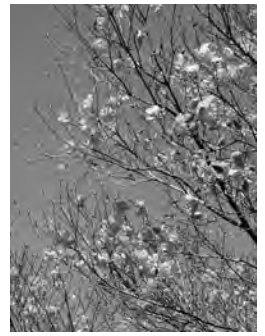
▲見事に咲き誇るアカヤシオ

山 には山、川には川でしか味わえない良さ、さらには川根本町でしか味わえない「川根時間」が流れています。今年度の目標は、それらを本町の皆さんに体験してもらうために、町民対象のプログラムを企画する予定です。本町の魅力をまずは町民の皆さん自身が感じ、一人ひとりに町の広報大使になってほしいと考えています。「川根よいところ、いつでもおいで！」とみんなでお知らせして、町を盛り上げていきましょう。