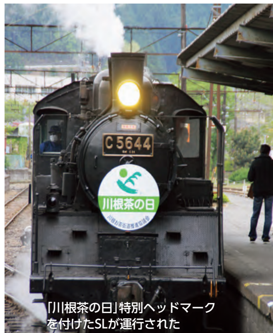
「川根茶の日」特別ヘッドマークを付けたSLが運行された