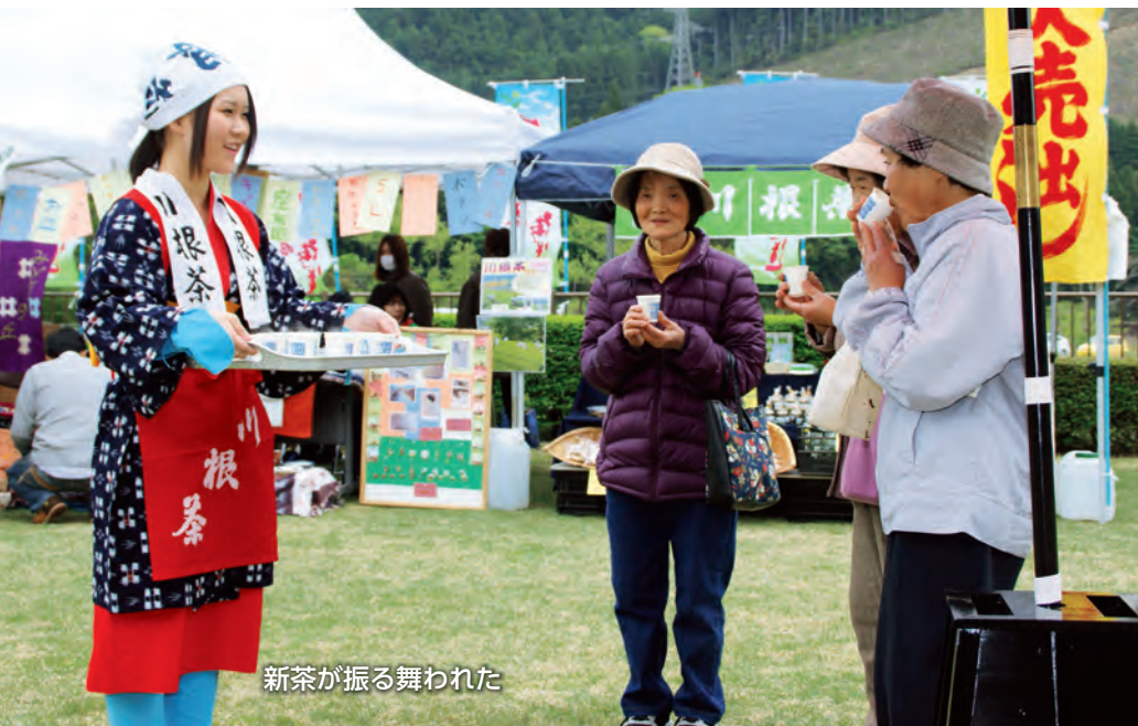
新茶が振る舞われた