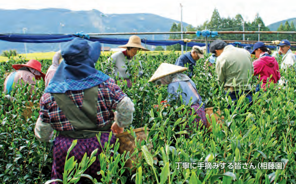
丁寧に手摘みする皆さん(相藤園)

そしてこの町も、川根茶の伝統と誇りを受け継いでいくことで、成長し発展してきたのだと感じました。