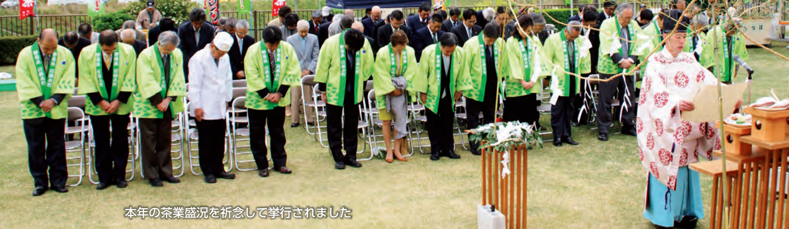
本年の茶業盛況を祈念して挙行されました