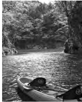
▲静寂に包まれた関の沢

28 日(日)には「大札山自然満喫トレッキング～アカヤシオの森を歩く～」を開催。今年で5回目の定番プログラムですが、今までで一番天候にも恵まれ、満開のアカヤシオを堪能しました。鳥のさえずりに耳を傾け、木々の芽吹きに春を感じ、山頂では遠く富士山までもが見渡せる。こちらでもカヤックプログラムに負けず劣