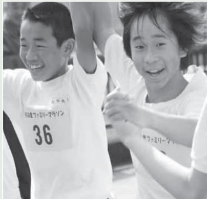
手をつないでゴール!

3月9日、朝。晴天。 役場本庁前駐車場にて、たくさんの方のジャージ姿 3年ぶり、川根本町になってからは初めての「お茶の 里ファミリーマラソン」のスタート会場です。 2年間、悪天候により開催が叶わなかったこの催し。 今年、眩しいほどのお日さまと、寒さも和らいた絶 好のマラソン日和となりました。 スタート前の会場には、入念にストレッチを行う一般 ランナーの姿や、親子で楽しそうに会話する姿などが見 られ、その場にいるだけで楽しい気分になってきます。 そして午前9時30分、最初の種目「3キロの部」がス タート。ピストルの合図とともに一斉に駆け出した子ど もたち。どの子も、笑顔があふれエネルギーに満ちた表 情でカメラの前を通り過ぎていきました。 そしてこのあと、親子参加を対象とした2キロ、1キ ロの部が行われました。小さなお子さんをリードするお 父さんお母さんの一生懸命な姿、そして仲良く手をつな いでゴールする姿がたくさん見られました。 この日最終となる5キロの部は午前10時30分スタート。 中学生から一般ランナーまで、健脚自慢の約80人がエン トリーしました。 さすがに5キロの部、スタートラインに並ぶ顔からピ リッとした雰囲気伝わってきます。ちよつと怖い…。 号砲一発、弾丸のように飛び出したランナーたち。そ のスピードはすさまじく、さながら短距離走のよう。カ メラは一瞬にして追い抜かれ、ファインダー越しに後ろ 姿を追いつけることしかできませんでした。 どの選手も、腕や足の筋肉の躍動感が違います。 トップのゴールタイムは17分33秒。 あつという間に、お茶の里の5キロを駆け抜けました。 全種目が終わり、走り終えたランナーたちは疲れ切っ た顔をしていましたが、どの顔からも満足感にじみ出 ているようにも見えました。 選手、スタッフの皆さん、お疲れさまでした。