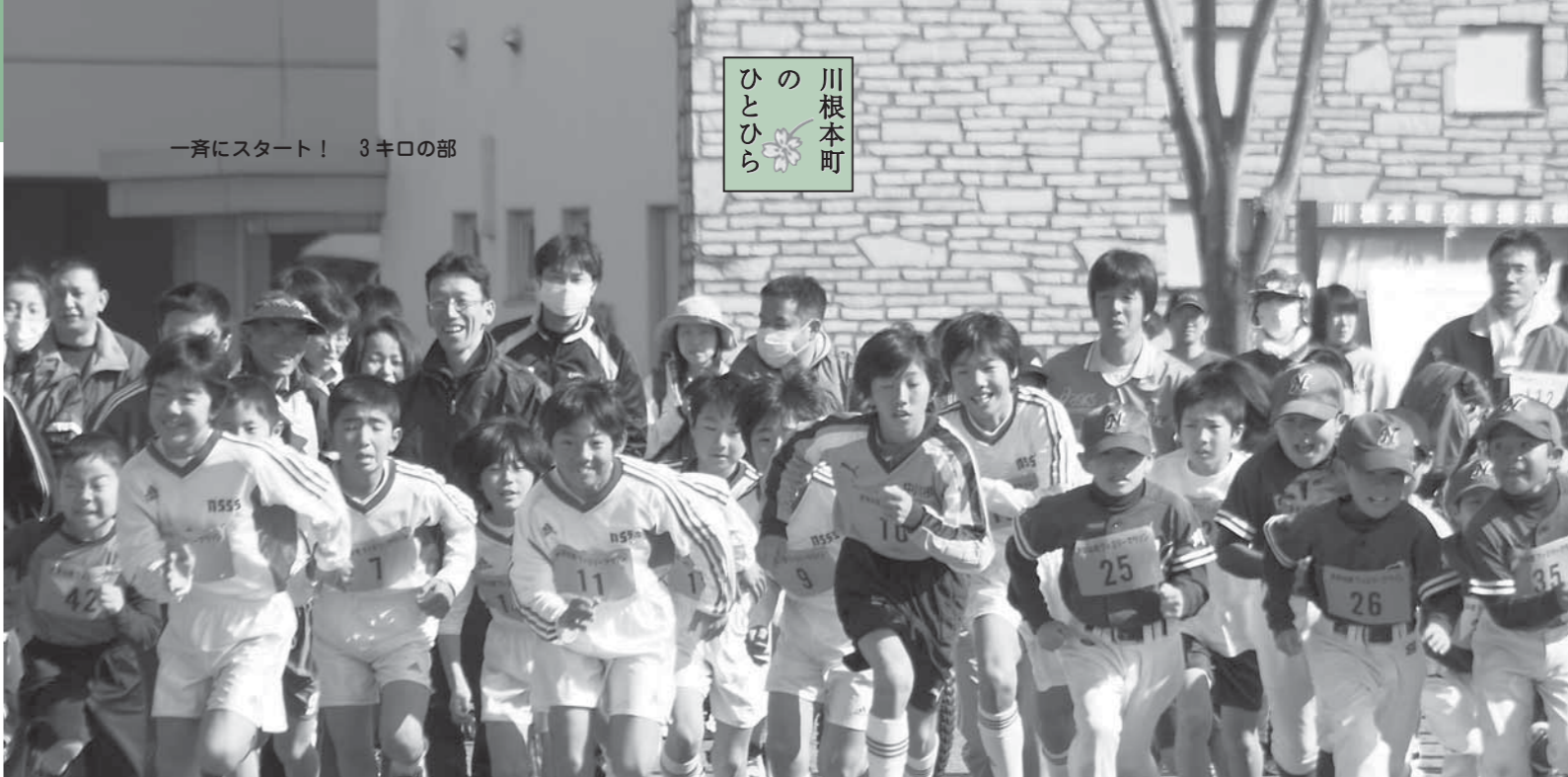
一斉にスタート! 3キロの部