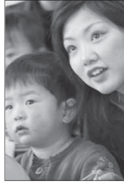
人形劇も鑑賞しました

ある日のすこやかサロンにお邪魔しました。この日は親子なかよし広場と合同で開催され、多くの参加者が集いました。山村開発センターで絵の具で自由に絵を描いたり、親子の手形をとったりしてみんな楽しそうに遊んでいました。表紙写真は体育館で遊んでいるところにお邪魔して撮った1枚です。逆光の中、訴えかけるような男の子の目線が写真の雰囲気を出してくれました。今号の特集のテーマをイメージしたとき、自然とこの写真を手にとっていました。