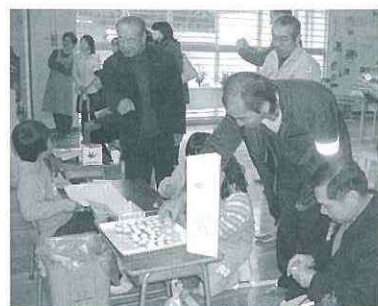
たくさんの方が見てくれた学習発表

思ったより大勢の方に見て いただいたので、うれしく なりました。 改めて、ぼくたちは、大 勢の方に支えられて今まで 楽しく過ごしてこれたのだ なあと感じました。北小の 生活も残り少なくなりまし た。全力でがんばりたい と思います。