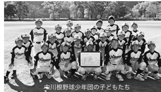
中川根野球少年団の子どもたち

昨年11月下旬、本町社会教育グラウンドなどで第31回選抜少年野球学童部川根大会が開催されました。県内各地から計16チームが参加し、熱戦を繰り広げました。中川根野球少年団は、順調に準決勝まで勝ち進みました。準決勝では、同点ルールにより惜敗したものの、前回大会同様「3位」に輝きました。この大会を目標とし、1年間チー